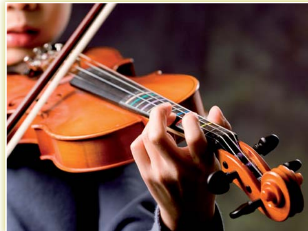
Si del cor i el pensament en sorgeixen la nota fonamental i la melodia, el cos fa la música.

El Picc:Dp ajuda l'infant a "afinar-se", li dona la pràctica de la tècnica i el prepara per automatitzar l'acte de parlar i d'escoltar.